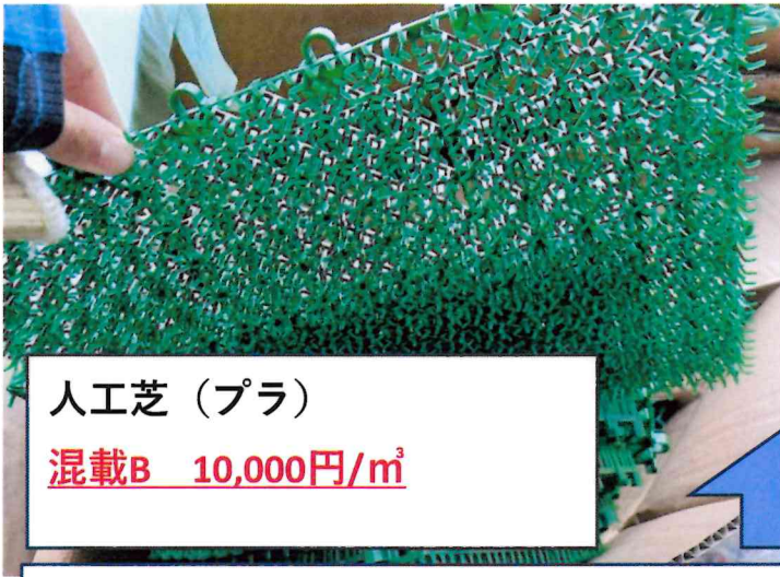
人工芝（プラ） 混載B 10,000円/m 3