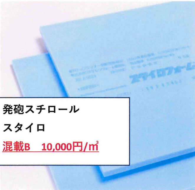
発砲スチロール スタイロ 混載B 10,000円/m 3

人工芝は上記のようにプラで出来ているか、ゴムが付着しているかで処分費は変わります。★ポイント★ 人工芝に土が付いていると、 18,000/m 3 の単価になるので土を取り除いて持ち込む事が 重要です！！