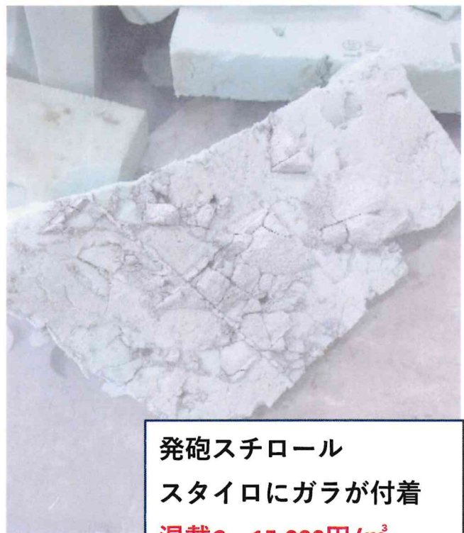
発砲スチロール スタイロにガラが付着 混載C 15,000円/m 3