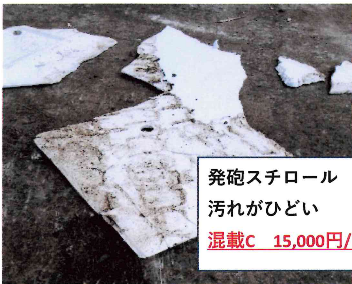
発砲スチロール 汚れがひどい 混載C 15,000円/m 3