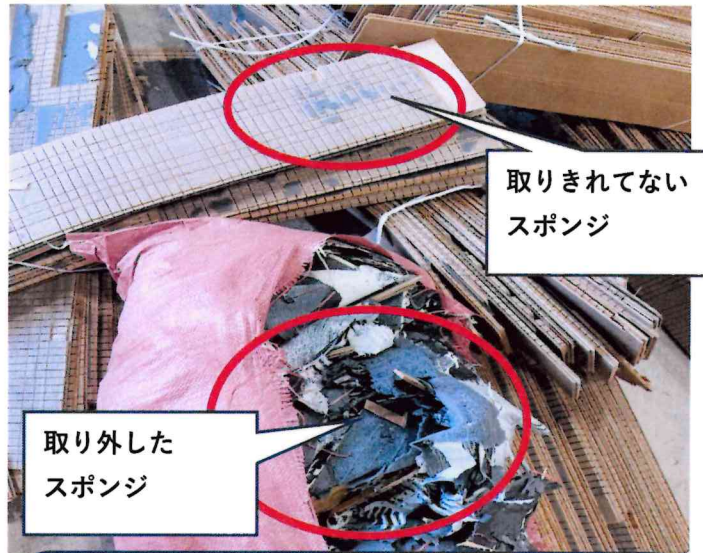
取りきれない スポンジ