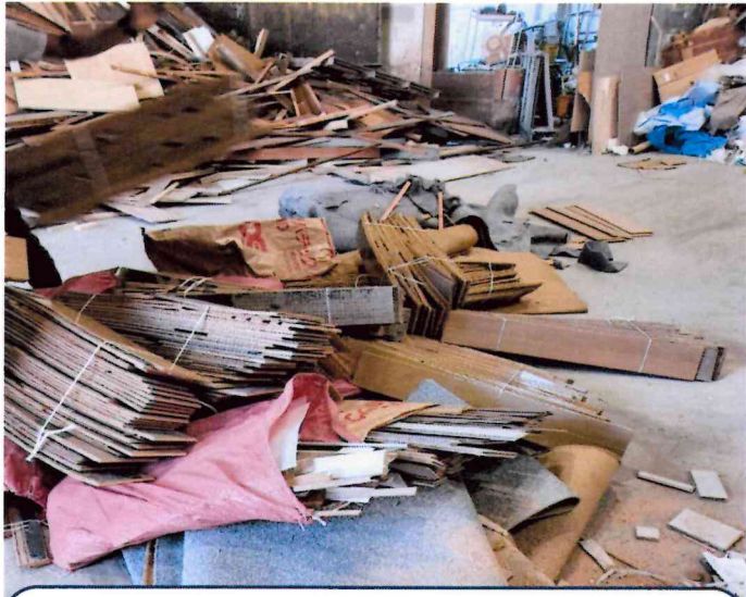
フローリングとプラ