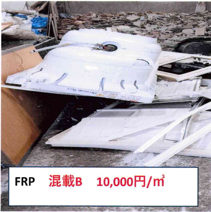
FRP 混載B 10,000円/m 3